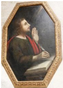
Saint Jean, avec l'aigle (l'aigle est à droite de la main levée)