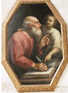
Saint Matthieu, avec l'homme