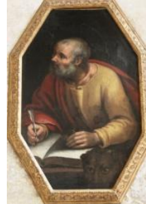
Saint Marc, avec le lion (le lion est en bas à droite du tableau)