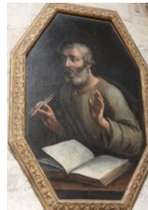
Saint Luc, avec le taureau (le taureau est au-dessus de la plume)

❖ Nous les découvrons également aux quatre coins de la Collégiale.